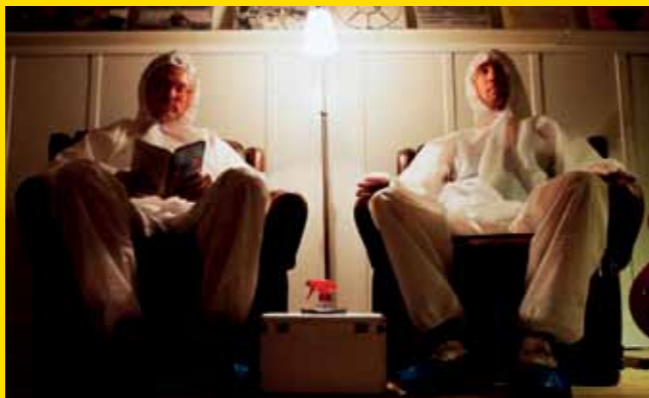
Fikapaus - Coffee Break

Depois do dia seguinte ( After the Day After ) Um remake de animação