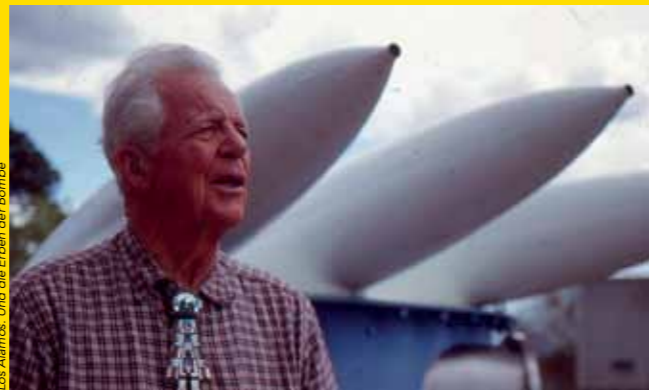
Los Alamos. Und die Erben der Bombe

18H30 Era uma Vez na Cidade Atômica Cidade do semi-árido paraibano recebeu, na década de 1950, a visita de cientistas norte-america-