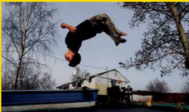
Uranium City: Life After The Mine

18H Enterrado na pele da Terra ( Buried in Earthskin ) África do Sul: uma jornalista numa viagem investigativa sobre energia nuclear e lixo atômico e