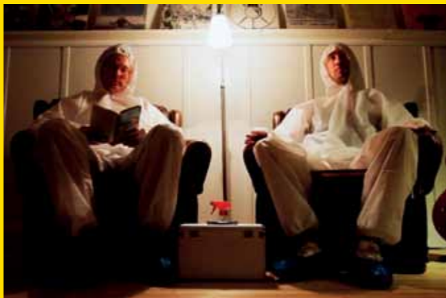
Fikapaus - Coffee Break

A quem interessar possa ( To whom it may concern ) Uma reportagem na Bielorrússia sobre os riscos da comida contaminada com baixa radiação. Bielorrússia, 1990, 26 min, inglês, direção Galina Laskova-Sanderson. Classificação indicativa 16 anos.