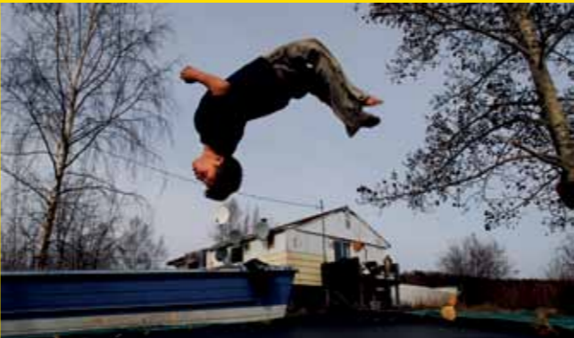
Uranium City: Life After The Mine

Cidade Urânio – a vida depois da mina ( Uranium City: Life After The Mine ) Na cidade Sask, 8 mil pessoas viveram da mineração de urânio. Mas a mina fechou em 1982. Canadá, 2008, 7 min, inglês/legenda inglês, direção Daniel Hayduk. Classificação indicativa 16 anos.