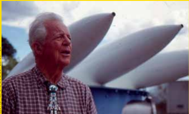
Los Alamos. Und die Erben der Bombe

Los Alamos e os Herdeiros da Bomba ( Los Alamos. Und die Erben der Bombe / The Secret and the Sacred. Two Worlds at Los Alamos. ) Documentário sobre um lugar em Novo México (EUA) onde nasceu a era nuclear e a primeira bomba atômica. Alemanha, 2003, 45 min, inglês, direção Claus Biegert, produção Denkmal-Film / Hessischer Rundfunk / Arte. Classificação indicativa 16 anos.